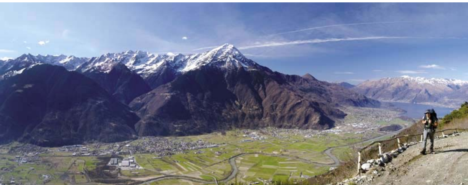
Bassa Valtellina e Alto Lario visti passeggiando per la tagliafuoco della costiera dei Cech.