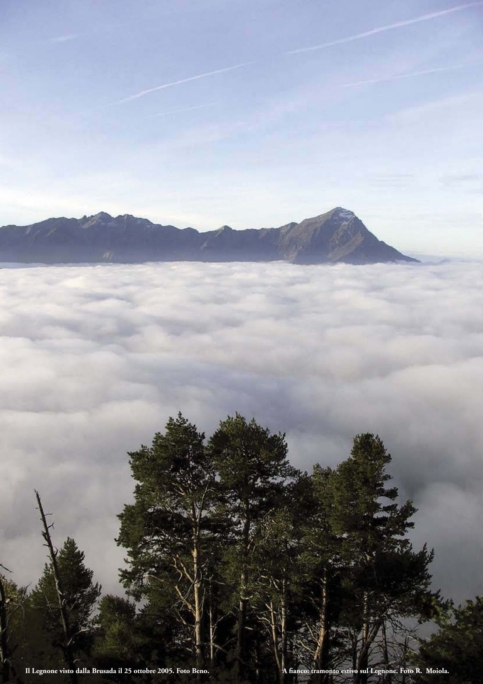
Il Legnone visto dalla Brusada il 25 ottobre 2005.